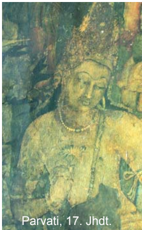
Parvati, 17. Jhdt.

Es hat eine erstaunliche Geschichte. Die erste, die das Rama Mantra gelernt hat, war niemand Geringeres als Parvati selbst, die Begleiterin von Shiva. Vor langer Zeit in der Heimat von Siva, saß Parvati auf dem Berg Kailash, saß und sang die tausend Namen von Vishnu, ein sehr langes, komplexes und zeitaufwendiges Gebet. Shiva war in Eile und wollte zu einer anderen kosmischen Verabredung, und er sagte ihr, daß es jetzt Zeit wäre zu gehen. Parvati erwiderte, daß sie nicht gehen könne, bevor sie ihre Gebete beendet hätte. Es war aber Shiva unmöglich, noch länger zu warten, und so sagte er: Parvati, sprich dieses Mantra: 'Om Sri Rama Jaya Rama Jaya Jaya Rama.' Es hat eine ähnliche Kraft wie die 1000 Namen von Vishnu, und nun laß uns gehen...'